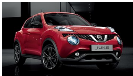
Avec son ADN musclé, le Nissan JUKE repousse les limites du crossover urbain. Un design unique