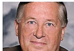
LES DERNIÈRES NOUVELLES D'ALSACE La faute de Mélenchon