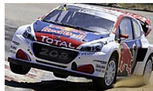
LES DERNIÈRES NOUVELLES D'ALSACE Loeb à Hockenheim