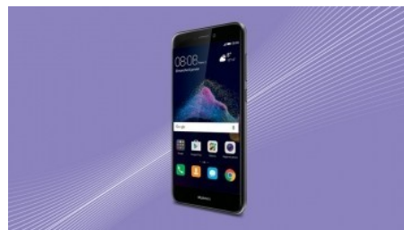
Entrepreneurs, le Huawei P8 Lite 2017 est à 1€ HT Équipez-vous !