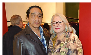
FEMME ACTUELLE Ces stars en couple depuis longtemps