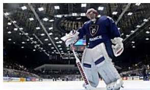
LES DERNIÈRES NOUVELLES D'ALSACE Un devoir et un rêve