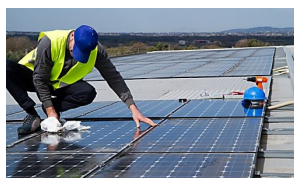
ECOLONERGIES L'installation de panneaux solaires est-elle rentable ?