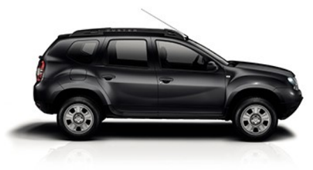
Découvrez les véhicules du personnel du Groupe Renault sur www.toprenault.com Dacia Duster