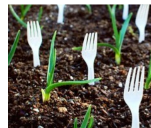
21 astuces de jardinage intelligent vos voisins jaloux 21 astuces de jardinage