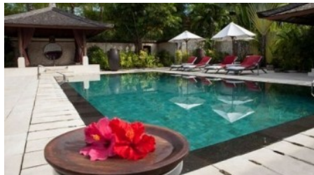
Découvrez l'Indonésie en séjour tout compris by Club Med jusqu'à -300€/personne Club Med Bali